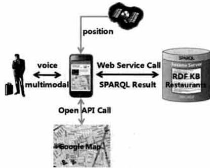
(그림 4) Smart Reservation의 구성도

텍 질의로 변환한 다음, 네트워크를 통해 원격의 식당 정보 웹서비스에 검색 요청을 보낸다. 그리고 웹서비스로부터 받은 검색 결과를 토대로 Google Maps Mashup 기능을 이용하여 식당 위치를 지도에 표시해줄 수 있을 뿐 아니라, 직접 온라인 식당 예약을 해줄 수 있다.