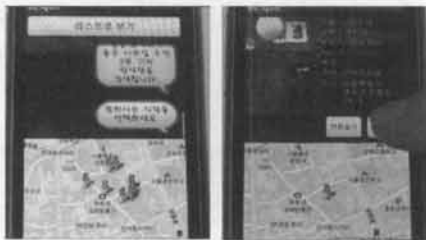
(그림 5) Smart Reservation의 실행 화면

Smart Reservation은 스마트 스크립트 시스템을 토대로 개발되었으며, 따라서 Smart Reservation의 주된 작업 지식은 스마트 스크립트들로 표현되어 스마트 스크립트 실행 엔진에 의해 수행되었다. Smart Reservation의 효과적인 구현을 위해 Open API 및 웹서비스 호출을 이용한 별도의 상태 변수들과 기본 동작들이 추가 구현되었고, 사용자의 편의성을 고려하여 음성 중심의 상호작용을 지원하는 새로운 사용자 인터페이스가 개발되었다. (그림 5)는 개발된 Smart Reservation의 실행 화면 중 일부이다. 현재 Smart Reservation의 구현은 서울 인사동 일대의 식당 정보만을 이용하는 한계점을 가지고 있음에도 불구하고, 몇 가지 시연을 통해 다양한 모바일 퍼스널 어시스턴트를 매우 효과적으로 개발할 수 있는 지원도구로서, 스마트 스크립트 시스템의 유용성을 보여주기에는 충분하였다. 네트워크의 상태에 영향을 받기는 하지만, 현재의 서비스 응답 속도도 사용자들이 충분히 만족할 만한 수준을 보여주었다.