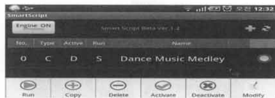
(그림 2) 스크립트 관리기의 실행 화면

실행 엔진이 스마트 스크립트 시스템의 논리적 의사결정(decision-making) 과정을 구현한 것이라고 보면, 별도의 Android 서비스로 구현된 실행기(Effector)는 웹브라우저, 캘린더, Email 프로그램 등 다른 기존의 전용 프로그램들을 이용하거나 Android API로 구현한 자체 프로그램을 이용하여 실행 엔진에서 요청하는 각각의 기본 작업/동작을 실제로 실행해주는 역할을 담당한다.